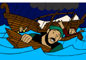
Pablo sobrevive a un naufragio