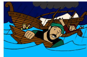
Pablo sobrevive a un naufragio