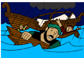
Pablo sobrevive a un naufragio