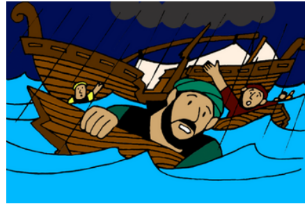
Pablo sobrevive a un naufragio