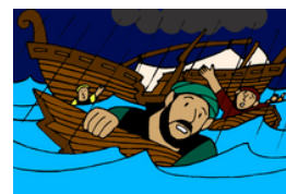
Pablo sobrevive a un naufragio