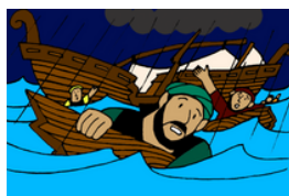
Pablo sobrevive a un naufragio