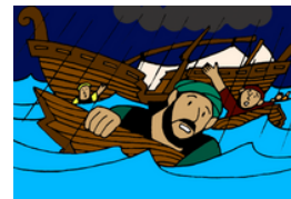
Pablo sobrevive a un naufragio