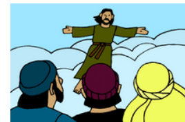
La Gran Comisión y la ascensión de Jesús