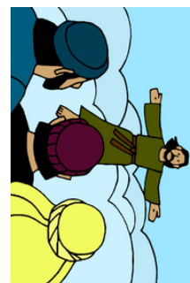
La Gran Comisión y la ascensión de Jesús