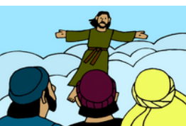
La Gran Comisión y la ascensión de Jesús