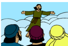
La Gran Comisión y la ascensión de Jesús