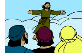
La Gran Comisión y la ascensión de Jesús