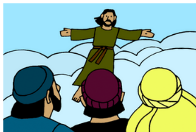
La Gran Comisión y la ascensión de Jesús