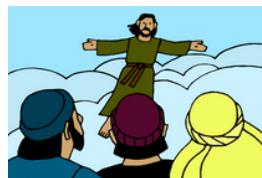
La Gran Comisión y la ascensión de Jesús